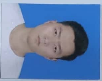
(无国家开放大学钢印无效)